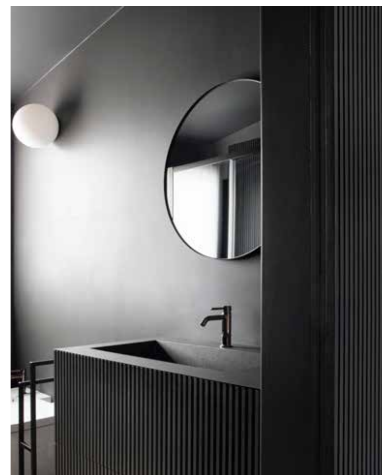
In questa pagina, in alto, a destra, la camera da letto padronale con boiserie cannettata che diventa testata del letto (su disegno Dainelli Studio ); di fianco, comodino di modernariato anni 40 con struttura in ottone e piano in marmo; armadio su disegno laccato antracite. Qui sopra, uno dei due bagni con lavabo e mobile lavabo in frassino tinto nero. Rubineria Artis modello Stilo in nikel nero e lampada Dioscuri di Artemide . In basso, il secondo bagno con lavabo su disegno rivestito in marmo nero marquinia e rubineria Artis Stilo in nikel.