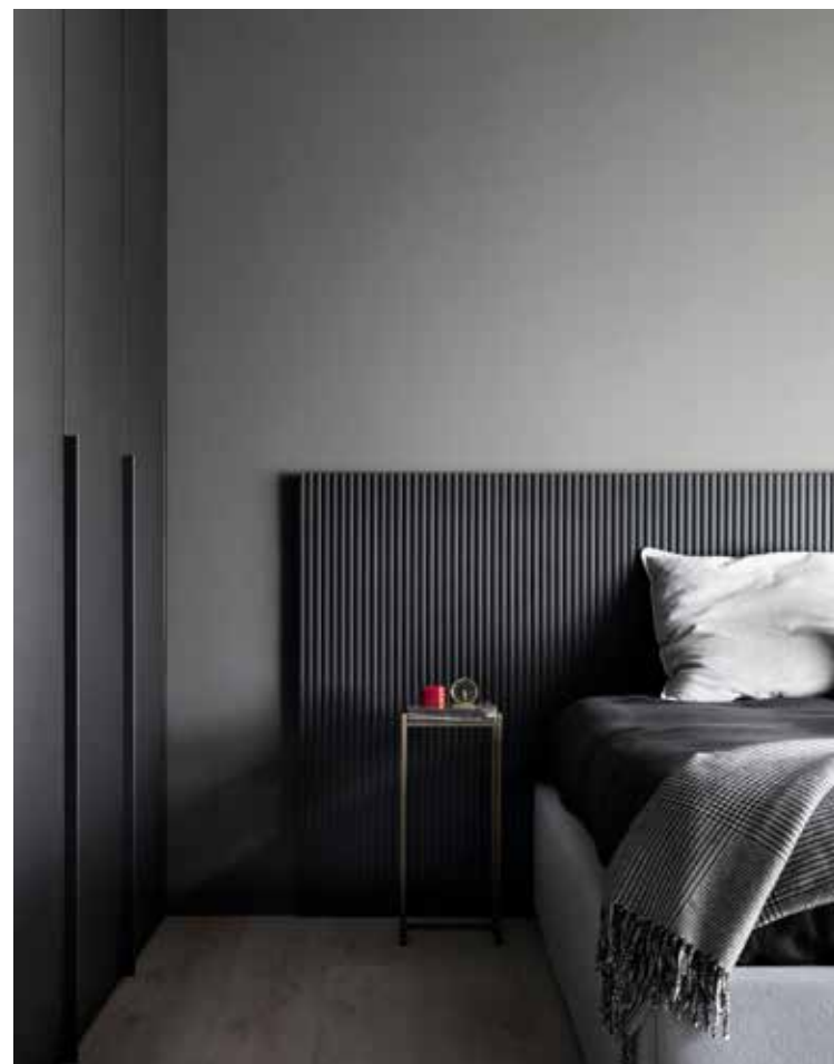
On this page, above, right, the master bedroom with quilted boiserie that becomes the headboard of the bed (designed by Dainelli Studio ); next to the bed, a 1940s modernist bedside table with a brass frame and marble top; bespoke wardrobe in anthracite lacquer. Above, one of the two bathrooms with washbasin and vanity unit in black-stained ash. Artis Stilo model faucets in black nickel and Dioscuri lamp by Artemide . Below, the second bathroom with custom-made washbasin covered in black Marquinia marble and Artis Stilo model faucets in black nickel.