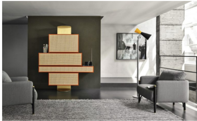
'N'NY', design storagemilano

A disegnare le proposte per la collezione 2020 di Gebrüder Thonet Vienna sono sia nomi già vicini all'azienda sia nuove collaborazioni. Firme progettuali differenti che reinterpretano il valore del passato e l'eredità stilistica del marchio legata all'introduzione della tecnica di lavorazione del legno di faggio curvato a vapore. Tra le novità, il nuovo ampliamento di gamma con i mobili contenitori 'N'NY' e 'MOS', scelta che segue l'introduzione delle testiere presentate nel 2019 e afferma la volontà dell'azienda di offrire proposte d'arredo più complete sia in ambito residenziale sia in ambito hospitality e hotellerie.