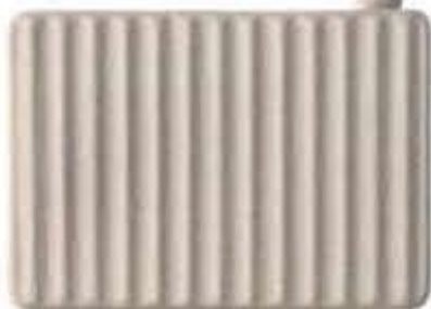
Applique "Umarèll" in ceramica opaca e sorgente LED KARMAN.