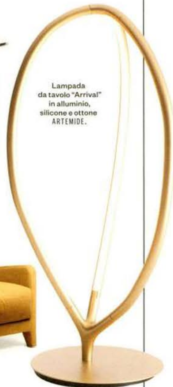
Lampada da tavolo "Arrival" in alluminio, silicone e ottone ARTEMIDE.