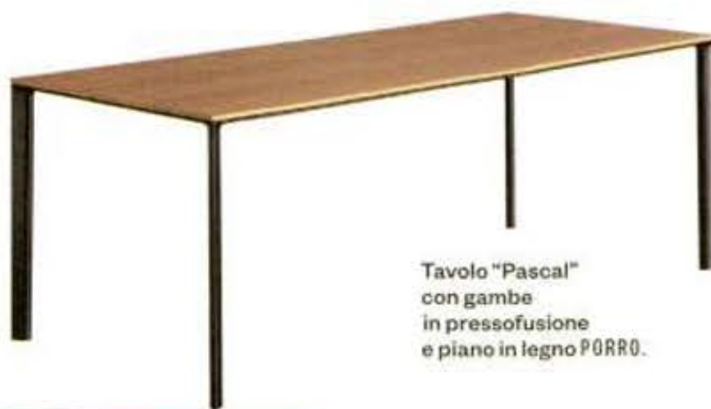
Tavolo "Pascal" con gambe in pressofusione e piano in legno PORRO.