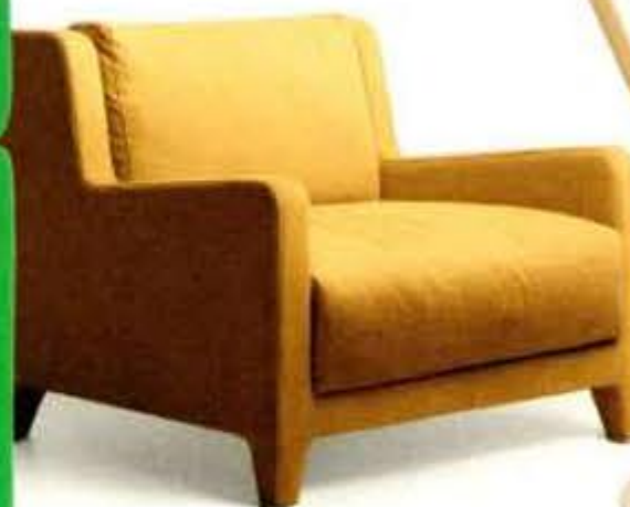
Poltrona comfort "Alma", sagomata in stile anni Quaranta LEMA.