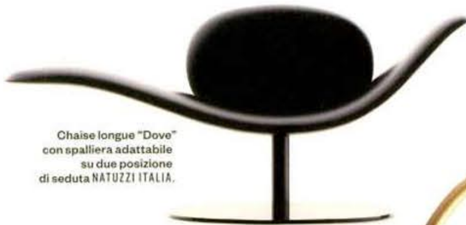
Chaise longue "Dove" con spalliera adattabile su due posizioni di seduta NATUZZI ITALIA.