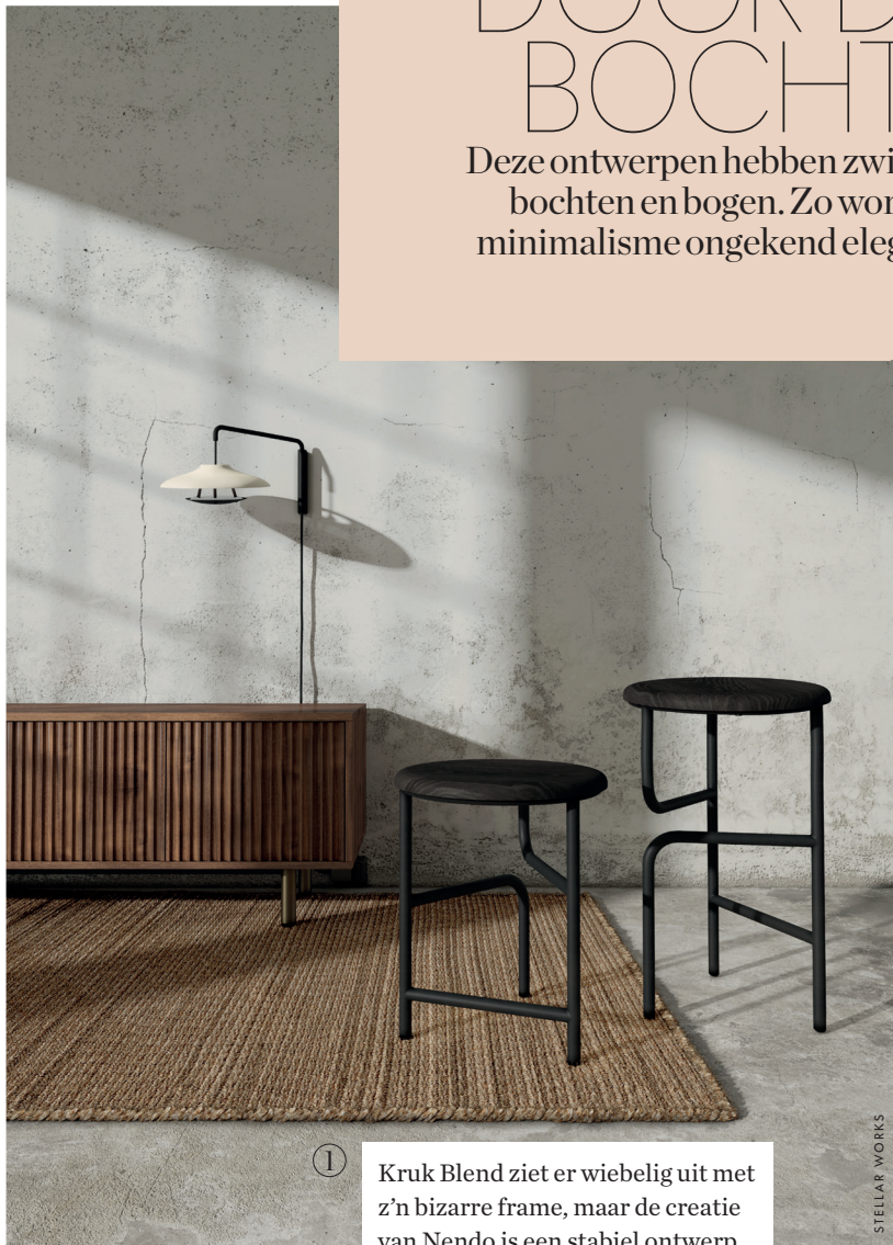
① Kruk Blend ziet er wiebelig uit met z'n bizarre frame, maar de creatie van Nendo is een stabiel ontwerp. Het frame is van zwart metaal, de zitting van eiken of walnoten hout en de bekleding van leer of stof. va € 357, stellarworks.com

Deze ontwerpen hebben zwaar bochten en bogen. Zo wordt minimalisme ongekend elegant.