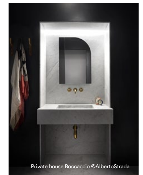
Private house Boccaccio ©AlbertoStrada