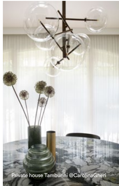
Private house Tamburini @CarolinaGheri

Our culture and Tuscan origins continuously connect us with natural elements: woods, stones, and marbles, the main actors of our projects. Marble is a form of art sculpted by nature itself, with multiple interpretations, accompanying us on a journey of continuous discovery and experimentation. It's an encounter between our creative thinking and its grandeur, blending aesthetics and functionality into one harmonious form. Its versatility constantly inspires us to explore new shapes and solutions, pushing the boundaries of creativity. Each piece is unique in its kind, carrying a millenary history and intrinsic beauty. While shaping our projects, we seek to enhance this natural beauty, allowing the marble to become the protagonist.